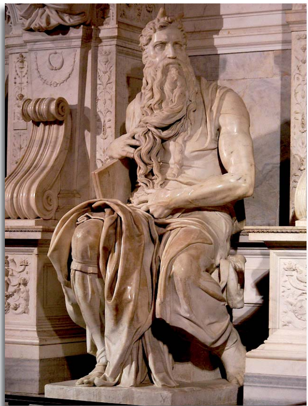
Mozes - door Michelangelo

Zij antwoordden: Een Egyptenaar heeft ons geholpen tegen de herders en bovendien volop voor ons geput en de kudde gedrenkt. (Exodus 2:19)