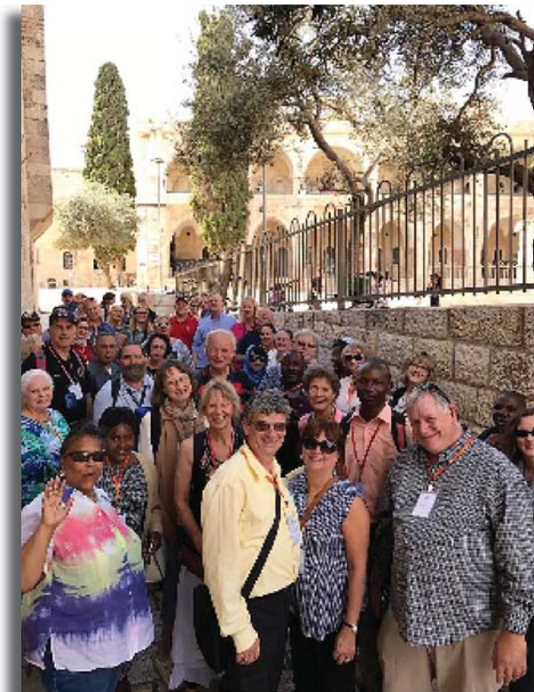
November Study Tour Group 2016

Geen volk ter wereld is in zoveel landen verstrooid geweest als mijn volk. Zelfs als we vele eeuwen in deze landen hadden gewoond, zelfs als we dachten dat we deel uitmaakten van deze landen in de verstrooiing en hun taal spraken, wisten we dat we ooit naar Sion zouden terugkeren, omdat ons begin daar ligt en nergens anders – dat was op de berg Moria.