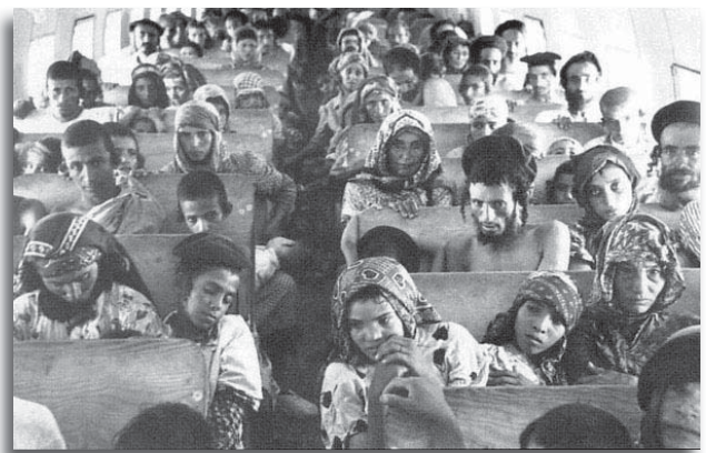
Operatie Vliegend Tapijt (Magic Carpet)

Weet u waar een groot deel, ca. 750.000 Joden, vandaan kwam? Uit Arabische landen, waar na de vestiging van de Joodse staat hun leven onmogelijk werd gemaakt. Ze kwamen totaal berooid in Israël, hun eigendommen waren geconfisqueerd en de wereld zweeg. De meesten hadden al vele generaties in deze landen gewoond, sommigen woonden er al voor de Arabieren kwamen. Joden hebben meer dan 2000 jaar in deze landen bij de Middellandse Zee gewoond.