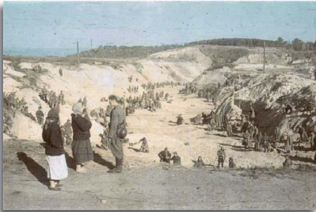
In twee dagen tijd werden 34.000 Joden doodgeschoten. Daarna werd het massagraf met aarde toegedekt.

Dit was een moeilijke ervaring voor me. Ik kon het gezelschap in Babi Yar in de open lucht toespreken. Ik kon de mensen hun tranen zien wegvegen. Ik heb het verhaal al vanaf mijn kindertijd in Jeruzalem gehoord. Toen ik de groeve zag, waar mijn Joodse Volk als oud vuil was weggegooid, kwamen deze woorden in mijn hart: "Hoor toch hoe het bloed van je broer uit de aarde naar mij schreeuwt." (Genesis 4:10b)