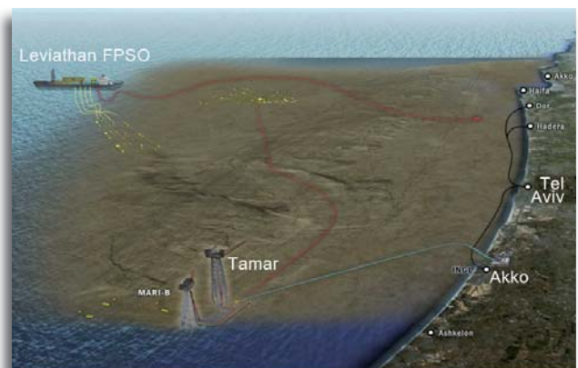
De gasvelden voor de Israëlische kust. Links-boven Leviathan FPSO: Floating Production, Storage and Offloading, dat is een speciaal soort schip dat gebruikt wordt om aardolie of gas te behandelen en op te slaan.

Eén van de mogelijkheden is de ontwikkeling van op afstand bestuurbare robotschepen, bewapend met een raketstelsel. De marine wil ook onbemande vliegtuigen kopen, die torpedo's en zelfmoord-duikers kunnen opsporen en uitschakelen