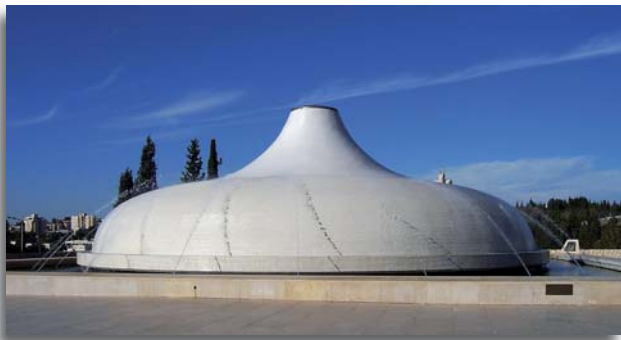
Shrine of the Book het museum van de Dode Zeerollen in Jeruzalem

tekst van de Hebreeuwse Bijbel. De tekst van de Hebreeuwse Bijbel, die bekend staat als de Masoretische tekst, is van generatie op generatie overgegeven, met ongeëvenaarde eensluidendheid en nauwkeurigheid overgeschreven. Er is grote aandacht besteed aan de exacte verwoording van de Bijbelse tekst, omdat het goddelijk geïnspireerd is en een gezaghebbende gids voor religieuze praktijk en geloof.