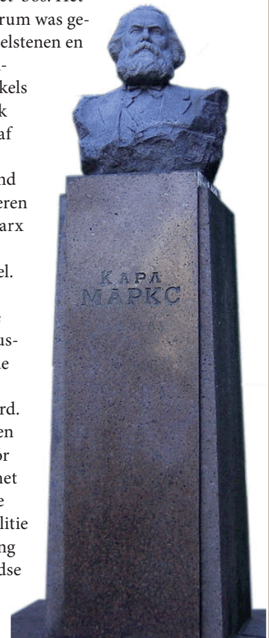
Radomysl: Karl Marx op een hoog voetstuk