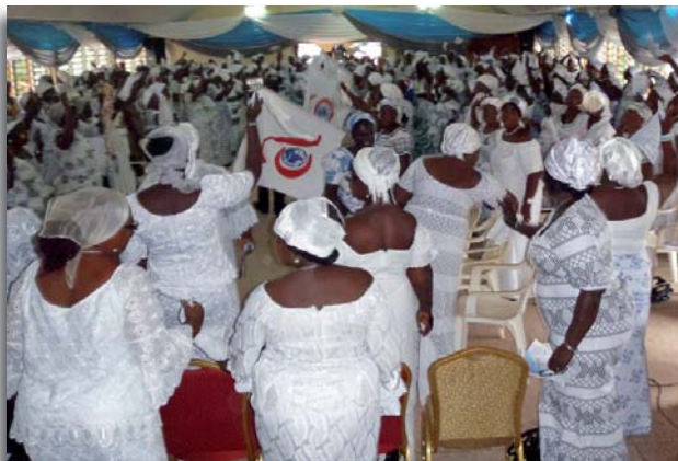
Tijd voor aanbidding in de stad Accra, Ghana

Ik kan dit bezoek niet vergeten en ik zou willen dat ik langer had kunnen blijven en dat ik zou kunnen terugkeren om het Goede Nieuws van Zion te verspreiden. Mijn hart staat in vuur en vlam voor deze mensen. Het is een biddend volk. In sommige kerken beginnen ze hun dag om 4u in de ochtend gezamenlijk met zingen en gebeden, voordat ze naar hun werk gaan. Ze verlangen naar het hemelse manna, hun dagelijks geestelijk brood. Ze vertrouwen volledig op Hem, ondanks hun dagelijkse moeiten en zorgen.