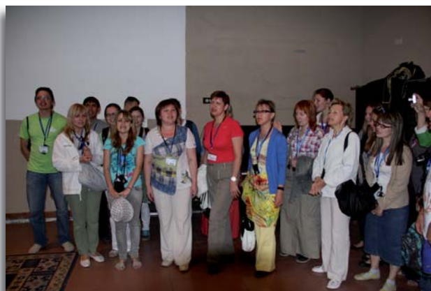
Groepsleden uit Rusland