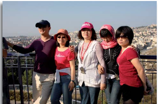
Groepsleden uit China

Buig u voor de HEER in zijn heilige glorie, huiver, heel de aarde, wanneer hij verschijnt. Vast staat de wereld, ze wankelt niet. Laat de hemel zich verheugen, de aarde juichen. Zeg onder de volken: "De HEER is koning." Laat bruisen de zee en het leven dat haar vult, laat het veld juichen en alles wat daar groeit, en laten de bomen jubelen voor de HEER, want hij is in aantocht, als rechter der aarde.