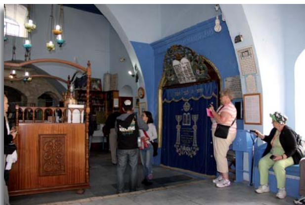
Bezoek aan een synagoge in oud Safed