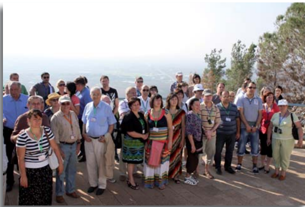
Groepsleden uit Oekraïne

Het zijn gezegende dagen, met een nieuwe open deur in het Land Israël, het thuisland van ons geloof. Het is een zegen om dit land te mogen bezoeken. Er waren mensen uit 24 landen, ze kwamen zelfs uit Beijing en Sjanghai, de grootste stad van China. We ontvingen rabbijnen, knesetleden en een afgevaardigde van het kabinet. De studenten reisden niet alleen door het land, maar elke dag bestudeerden zij het Woord. Overal waar we kwamen, ontvingen we een zegen en elke samenkomst was bijzonder.