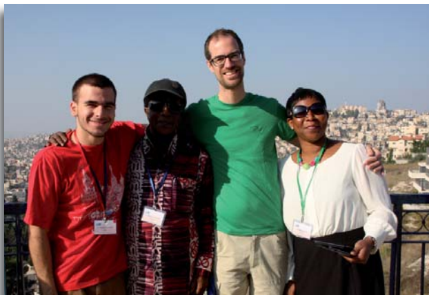
Groepsleden Amerika, Ghana, Nederland en Nigerië

Deze woorden waren in het gebed op mijn lippen. We werken maar met een paar mensen op het Centrum, we voelden een enorme verantwoordelijkheid, maar Hij was onze helper. Deze dagen hebben we 702 Bijbels verspreid. Dit is Zijn gezegende werk. Dank u, die dit hebt mogelijk gemaakt.