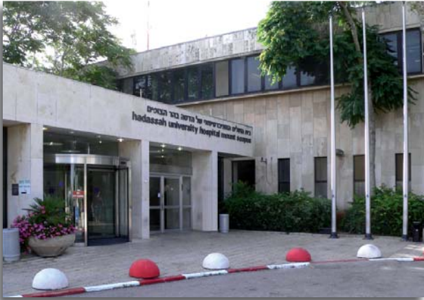
Hadassah University Hospital op Mount Scopus