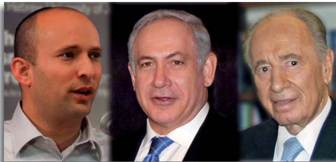
Naftali Bennett - Benjamin Netanyahu - Shimon Peres

Saeb Erekat, de belangrijkste onderhandelaar van de PA, heeft gezegd dat "iedereen die zegt dat hij de kolonisten in de Palestijnse staat wil laten blijven, in werkelijkheid zegt dat hij geen Palestijnse staat wenst. Geen enkele kolonist zal toestemming krijgen om in de Palestijnse staat te blijven, zelfs niet één, omdat nederzettingen illegaal