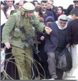
Medelijden met een Arabier