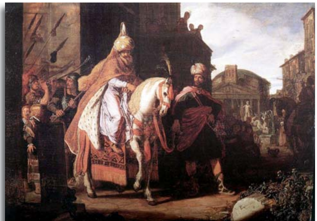
Pieter Pietersz. Lastman: de triomf van Mordechai

De naam van het feest Poerim komt van het Perzische woord Poer, dat 'loten' betekent. Het feest is namelijk genoemd naar de loten die werden gegooid om te bepalen op welke dag ze de Joden zouden doden. Juist deze loten symboliseren alles wat het traditionele jodendom verwerpt. Deze loten symboliseren dat de kans dat de