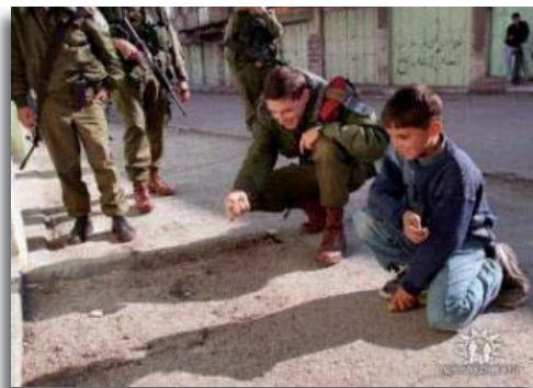
Een spelletje met een Arabisch jongetje

Uw gift is van harte welkom. NL16 INGB 0003199277 Bijbelstudie/onderz te Jerusalem