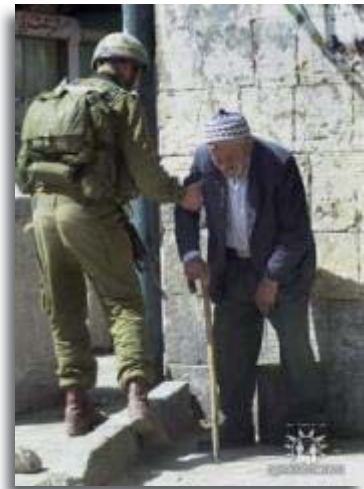
Medelijden met een Arabier