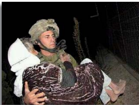
Een zieke Arabische vrouw wordt gedragen