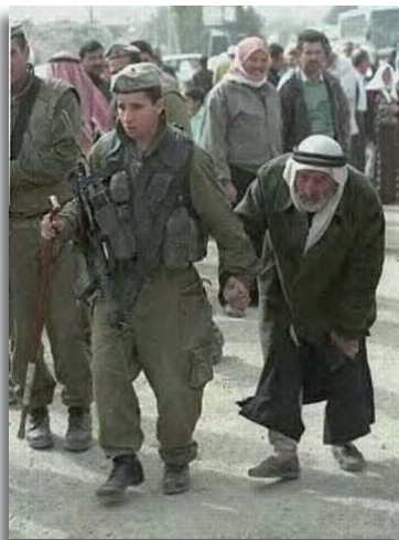
Israëliische soldaat helpt Arabier