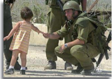
Aandacht voor een klein Arabisch meisje