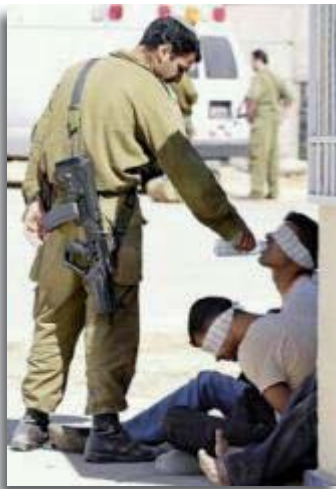
Water voor de vijand