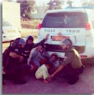
Kinderen vinden bescherming