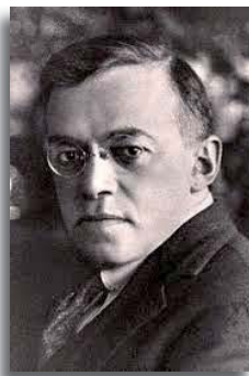
Ze'ev Jabotinsky zionistenleider en oprichter van het Joodse Legioen dat tijdens WOI met het Britse leger mee vocht 1880-1940