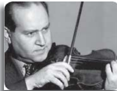
David Oistrach wereldberoemd violist 1908-1974