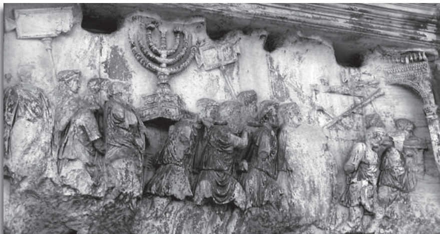
De zogenaamde Titusboog in Rome herinnert aan de wegvoering van de Joden en tempelschatten uit Jeruzalem. U ziet de 7-armige kandelaar afgebeeld, maar niet de Ark des Verbonds. Die was in de tweede tempel niet aanwezig.

Tisha b'Av begint op zaterdag 25 juli en eindigt op zondag 26 juli. Het is een treurdag die in vasten wordt doorgebracht.