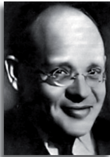
Isaac Babel beroemd journalist en auteur 1894-1940