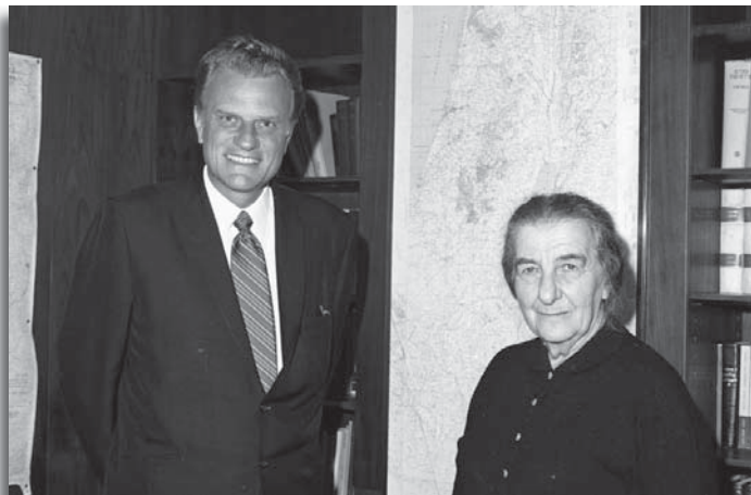
Israël, 1969, Billy Graham en Premier Golda Meir

nodig. We hebben kennis en begrip nodig. De Joden zijn al vanaf het begin het uitverkoren volk.