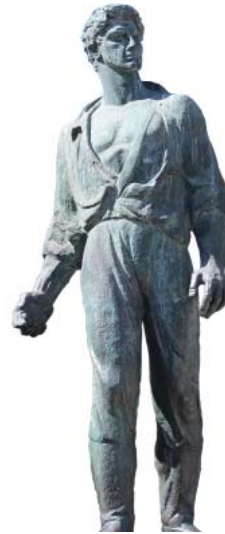
Standbeeld ter nagedachtenis aan Mordechai Anielewicz

begonnen de huizen van het getto in brand te steken. Op 8 mei werd de bunker op Mila 18, die als commandopost van de Joden diende, ingenomen en opgeblazen. De 24-jarige Mordechai Anielewicz en veel van zijn medestrijders werden in de bunker gedood. De gevechten in het getto hebben ongeveer drie weken geduurd en op 16 mei werd het getto ingenomen en met de grond gelijk gemaakt.